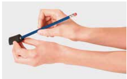
Die Stiftverdickungen der Rheumaliga Schweiz entlasten die Fingergelenke (siehe Bestell-Talon).

Jugendliche mit Rheuma können in der Regel ganz normale Berufe ausüben, wenn sie auf harte, körperliche Arbeit verzichten. Unterstützung bei Fragen zur Berufswahl finden Sie beim behandelnden Kinderreumatologen, der behandelnden Physiotherapeutin und der Berufsberatung.